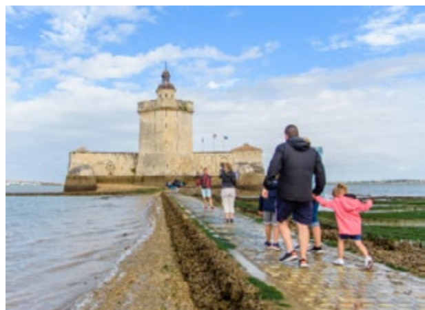
Le fort à marée basse

À marée basse , on accède au fort à pied en 10 minutes par une chaussée pavée de 400 mètres . L'amplitude d'accès est de 3 heures en moyenne selon le coefficient de marée.