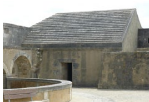
Magasin à poudre

Sur les remparts, deux canons de 24 sont montés sur affûts en chêne. A l'opposé du corps de garde, se trouve le magasin à poudre principal. Il abrite le moule de la sculpture du blason de Louis XIV.