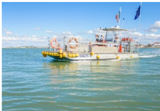
Navette «le Louvois»

À marée basse , on accède au fort à pied en 10 minutes par une chaussée pavée de 400 mètres . L'amplitude d'accès est de 3 heures en moyenne selon le coefficient de marée.