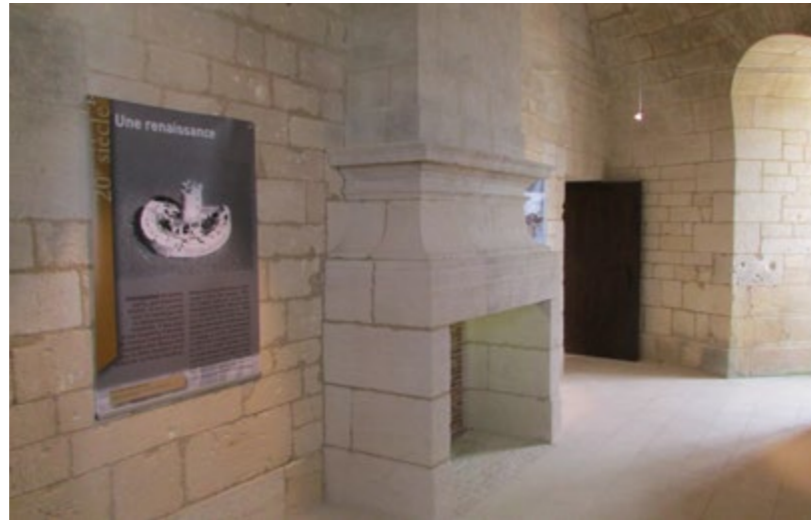
Intérieur du donjon

Le donjon s'élève sur 3 niveaux par un escalier en vis de 87 marches. Au rez-de-chaussée, une galerie dessert les latrines, un magasin à munition et une poudrière. Les étages sont réservés aux appartements des officiers et du Commandant. La plateforme d'artillerie à 24 mètres de haut offre une vue panoramique sur le coureau d'Oléron avec tables d'orientation entre chaque créneau. Une exposition chrono-thématique présente l'histoire du fort de sa construction à nos jours.