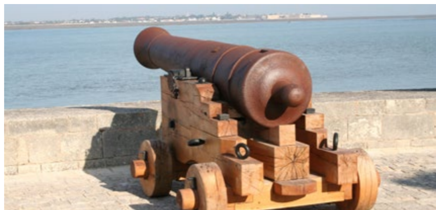
Canon de 24 livres